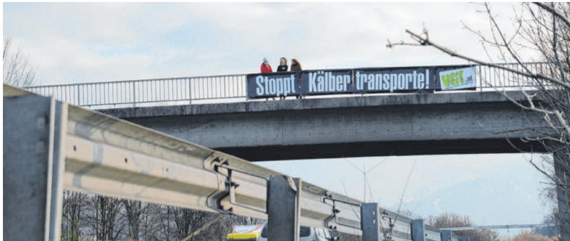
Mit einem Transparent haben gestern Tierschützer auf einer Autobahnbrücke bei Götzis gegen die Transporte protestiert. VGT

Zur Veranstaltung hatte Tierschützer Dieter Steinacher geladen. Am