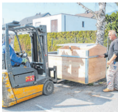
Nach dem Hochbeetbau ist vor dem Hochbeetbau.