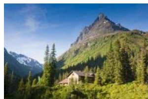
GEMEINDE Frauenbewegung St.Gallenkirch-Gortipohl – Zweitägige ...