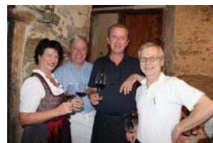
BILDSTEIN Musik und Wein beim