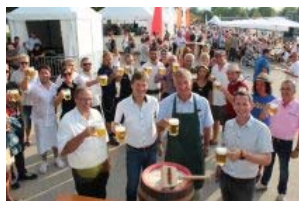
BREGENZ Bregenzer Hafenfest lockt an den See