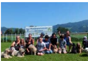
DORNBIRN Kind und Hund – gemeinsam