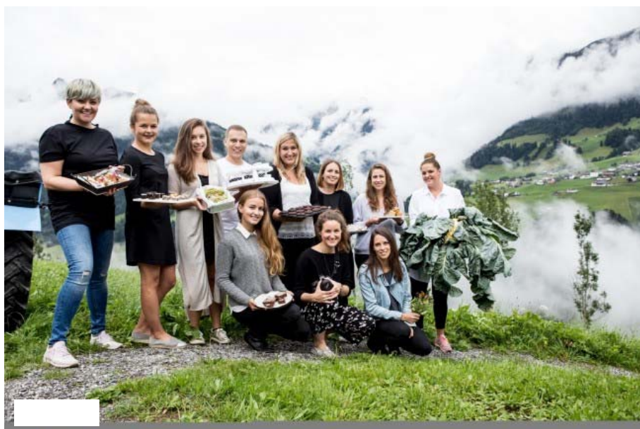
Elf Vorarlberger Foodblogger machen erstmals eine gemeinsame Sache

Von Thomas Knobel (VOL.AT) am 23. August 2017 13:08