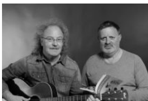
BLUDENZ Einladung zur Wanderlesung ...

NACHRICHTEN Welt Politik Wirtschaft Sport Kultur Stars Kurioses